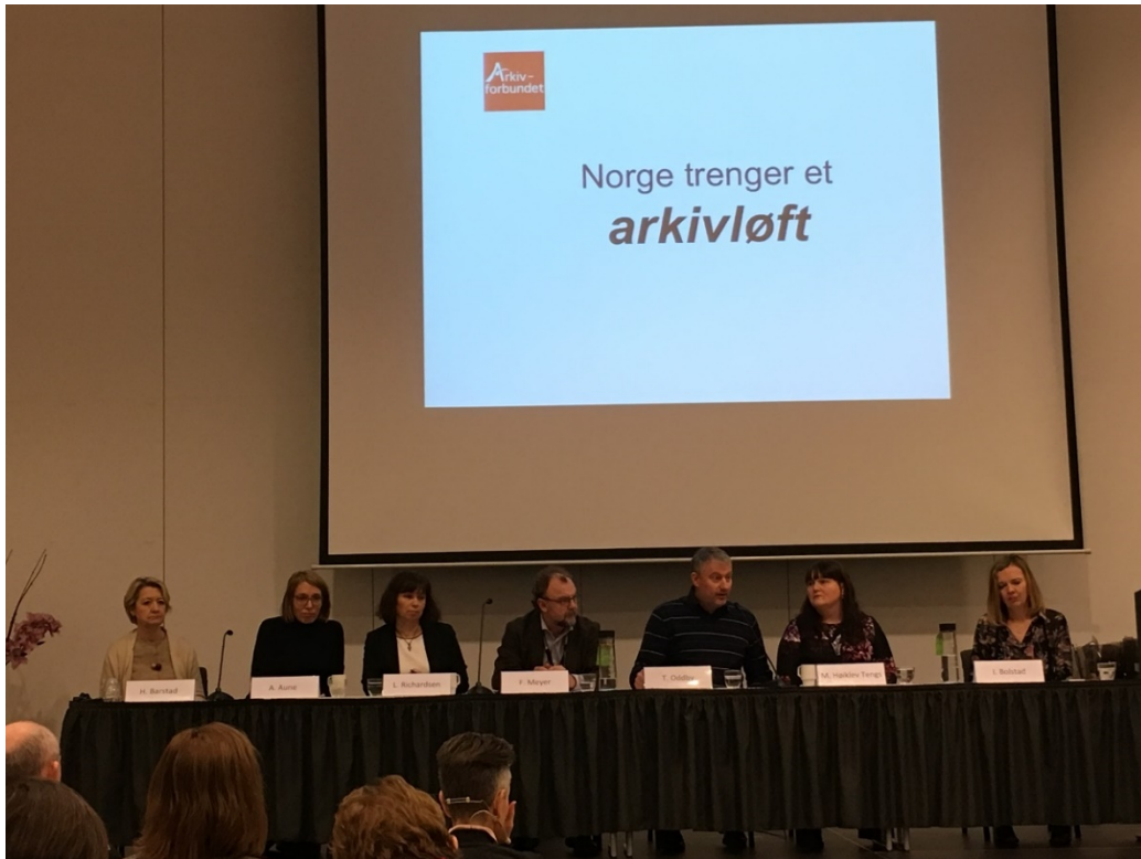
Arkivverkets SAMDOK-konferanse 31. januar 2018 på Gardemoen.

Styret for IKA Finnmark IKS, 26. mars 2018