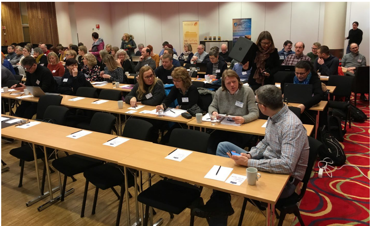
IKA Finnmark IKS med stand på KiNS GDPR roadshow i Alta.