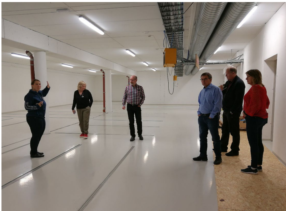
Styret 2018 på befaring i Gjenreisningsmuseets nybygde depot.

Det har vært avholdt 6 styremøter totalt i 2018. 4 fysiske møter, 2 telefonmøter. Styret har til sammen behandlet 45 saker. Mye av styrets møter og aktivitet har vært vedrørende utvidelse av arkivdepot, regionreform, bemanning, regnskap og budsjett. Styret får månedlige regnskapsrapporter.