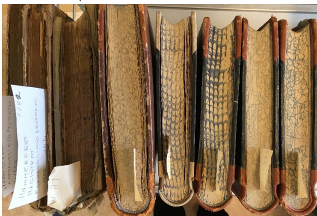
Prosjektleder for Struve Norge besøkte oss i sin reseach om Struves meridianbue, en UNESCOs verdensarv. Vakre, gamle protokoller venter på lesesalen.

innsynsforespørsler i forbindelse med slektsforskning i 2018. Brukerne etterlyser mer digitalt tilgjengelig arkivmateriale fra vårt depot.