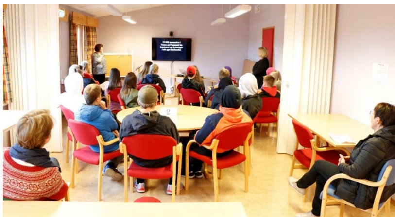
En skoleklasse får innledning om tvangsevakuering