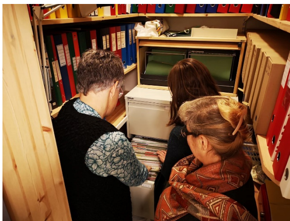
Befaringsbesøk hos kommuner. Kartlegging av arkiv.