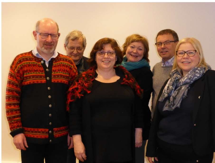
Styret og daglig leder.