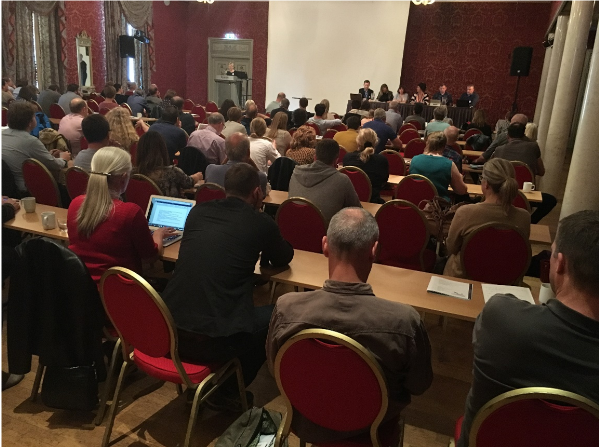
KAI-konferansen 2016, Sandefjord.