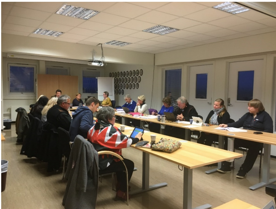
Nesseby kommunestyre hadde mange spørsmål og innspill før sin behandling av endring av vår selskapsavtale.

Det har også vært møter med Vegvesenet i forbindelse med drift av bygget og mulig salg av bygget på sikt.