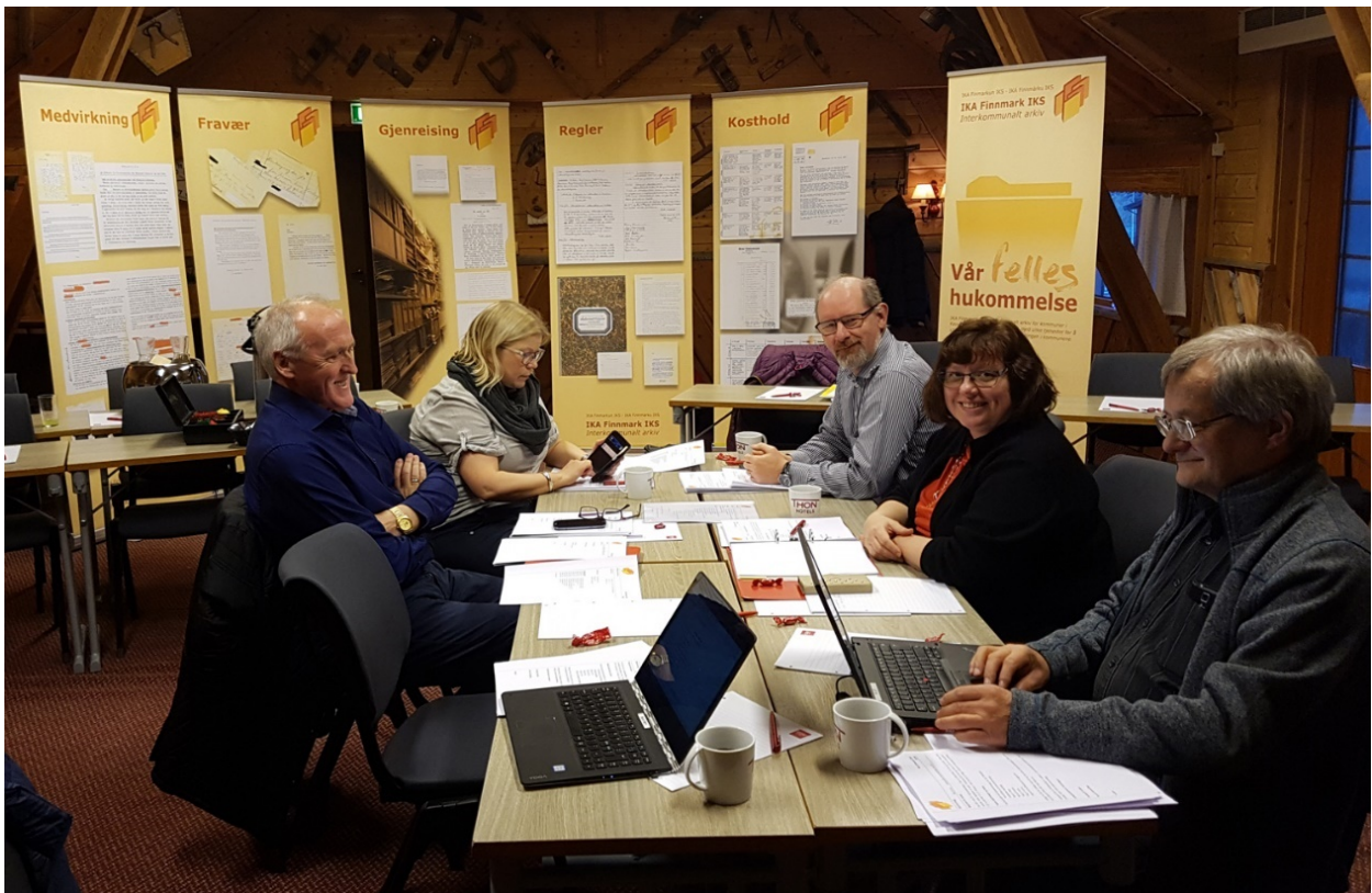
Deler av utstillingen vises til styret.

Det er ønskelig at utstillingen skal være noe vi kan benytte fremover i formidlingsarbeid og som viser dokumenter som kilde for formidling. Det ble laget en utstilling på 8 roll-ups. I tillegg ble det stilt ut noe litteratur om temaet. En PC på lesesalen viste nettstedet til «Samisk skolehistorie»