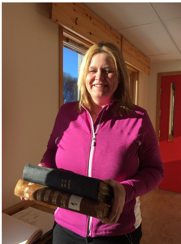
Gjemte skatter finner veien til vårt depot.